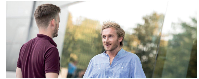
„Wenn es mir gelingt, jemandem Mut zu machen, macht mir das wiederum Mut.“ Samuel Koch